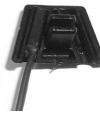
Öffner OHNE Magnet Opener WITHOUT Magnet Contact à ouverture SANS aimant