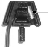
Schließer MIT Magnet Closer WITH Magnet Contact à fermeture AVEC aimant