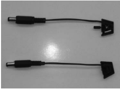
Sensor komplett Sensor cpl. Senseur complet

0689 771 printed in Germany ©MAGURA 2010 All rights reserved | 47g